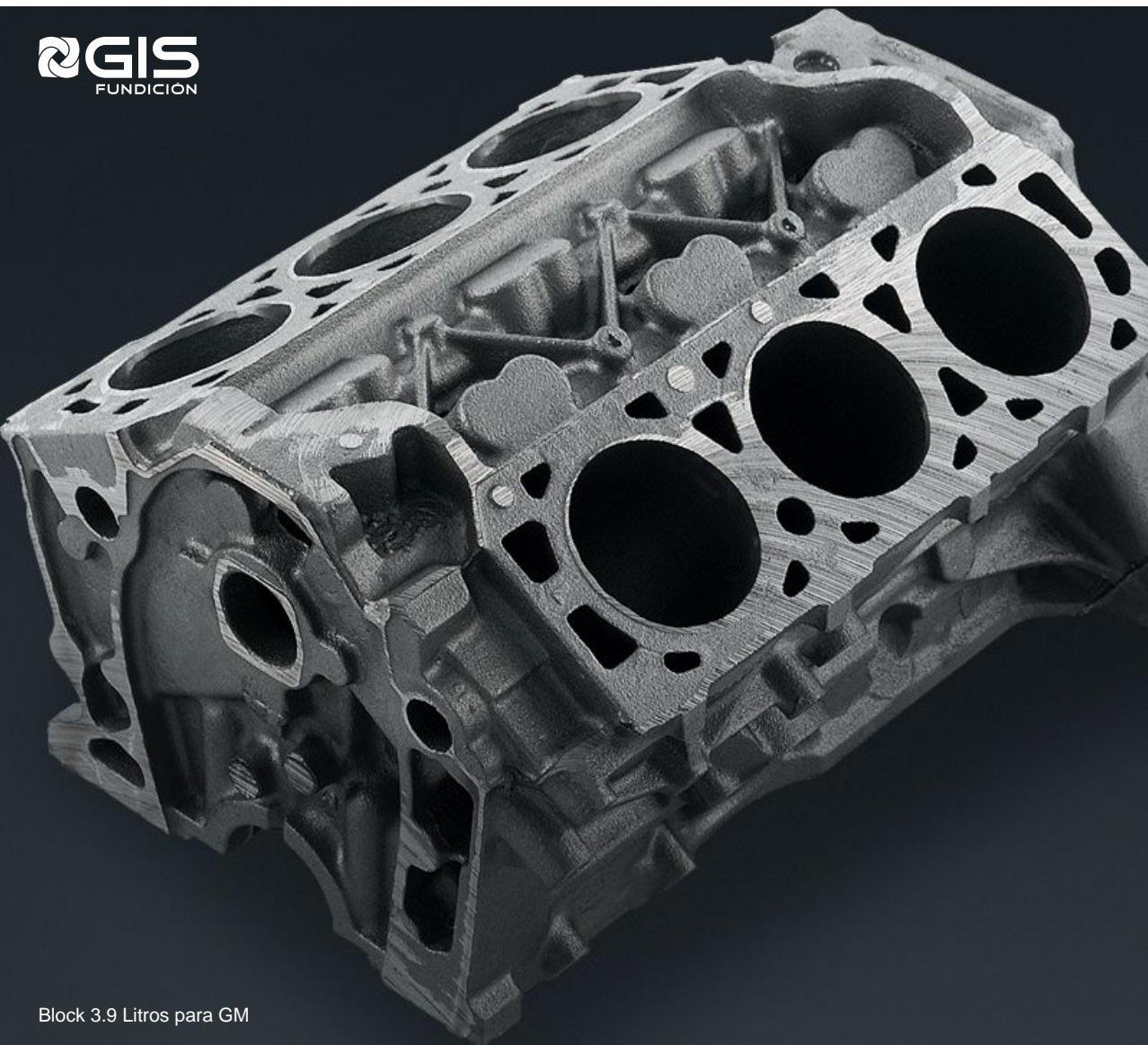
Block 3.9 Litros para GM